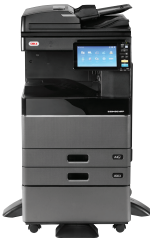
ES9466 MFP mit RADF und Schrank