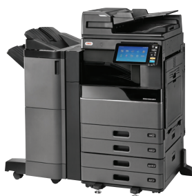
ES9466 MFP mit DSD, PPF, Schubladenmodul, Mehrfachheft-Finisher und Lochereinheit vorinstalliert